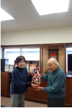
トロフィー贈呈式